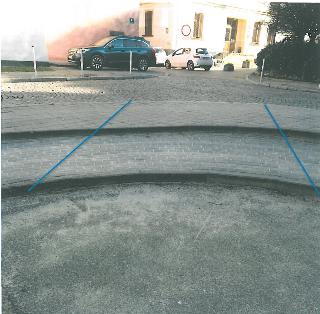
Rysunek 3. Obniżyć krawężniki robiąc gładki zjazd

Proszę o rozważenie powyższych wniosków.